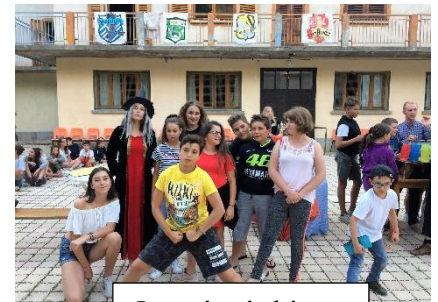
Journées à thèmes