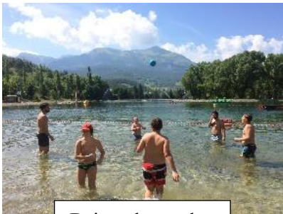
Baignade au plan d'eau de Jausiers

Activités manuelles - Journées à thème - Jeux Olympiques - Jeux Sportifs - Temps de réflexion - Veillées - Grands Jeux - Spectacles - Jeux de pistes