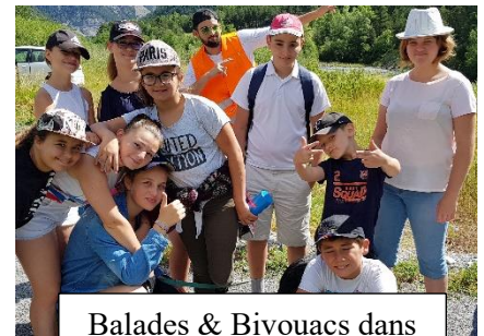
Balades & Bivouacs dans la Vallée de l'Ubaye

Activités manuelles - Journées à thème - Jeux Olympiques - Jeux Sportifs - Temps de réflexion - Veillées - Grands Jeux - Spectacles - Jeux de pistes