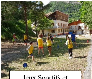
Jeux Sportifs et sports collectifs

L'EPN organise avec la paroisse Notre Dame des Rencontres son traditionnel séjour de vacances pour vos enfants et adolescents de 6 à 17 ans à la Condamine-Chatelard (04530)