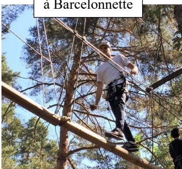
Accrobranche à Barcelonnette