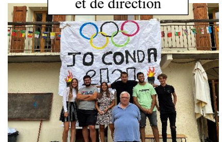
Equipe d'animation et de direction

Temps de partage dans le respect des convictions de chacun.