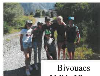
Bivouacs Vallée Ubaye