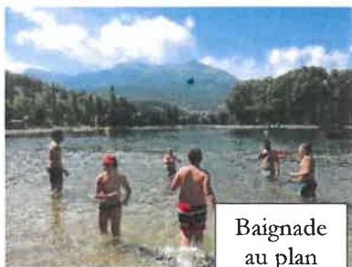
Baignade au plan d'eau Jausiers

Activités manuelles - Journées à thème - Jeux Olympiques - Jeux Sportifs - Temps de réflexion - Veillées - Grands Jeux - Spectacles - Jeux de pistes