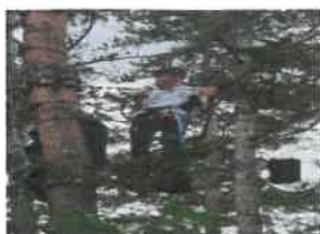
Accrobranche à Barcelonnette