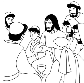
« Comme je vous ai aimés, vous aussi aimez-vous les uns les autres. » (Jean 13, 34)

Moi, Jean, j'ai vu un ciel nouveau et une terre nouvelle, car le premier ciel et la première terre s'en étaient allés et, de mer, il n'y en a plus. Et la Ville sainte, la Jérusalem nouvelle, je l'ai vue qui descendait du ciel, d'après de Dieu, prête pour les noces, comme une épouse parée pour son mari. Et j'entendis une voix forte qui venait du Trône. Elle disait : « Voici la demeure de Dieu avec les hommes ; il demeurera avec eux, et ils seront ses peuples, et lui-même, Dieu avec eux, sera leur Dieu. Il essuiera toute larme de leurs yeux, et la mort ne sera plus, et il n'y aura plus ni deuil, ni cri, ni douleur : ce qui était en premier s'en est allé. » Alors celui qui siégeait sur le Trône déclara : « Voici que je fais toutes choses nouvelles. »