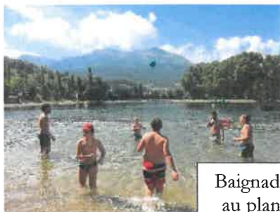
Baignade au plan d'eau

Activités manuelles - Journées à thème - Jeux Olympiques - Jeux Sportifs - Temps de réflexion - Veillées - Grands Jeux - Spectacles - Jeux de pistes