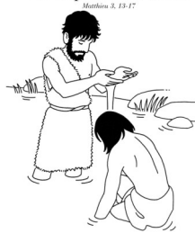
Le baptême de Jésus

E n ces jours-là, quand Pierre arriva à Césarée, chez un centurion de l'armée romaine, il prit la parole et dit : « En vérité, je le comprends, Dieu est impartial : il accueille, quelle que soit la nation, celui qui le craint et dont les œuvres sont justes. Telle est la parole qu'il a envoyée aux fils d'Israël, en leur annonçant la bonne nouvelle de la paix par Jésus Christ, lui qui est le Seigneur de tous. Vous savez ce qui s'est passé à travers tout le pays des Juifs, depuis les commencements en Galilée, après le baptême proclamé par Jean : Jésus de Nazareth, Dieu lui a donné l'onction d'Esprit Saint et de puissance. Là où il passait, il faisait le bien et guérissait tous ceux qui étaient sous le pouvoir du diable, car Dieu était avec lui. »